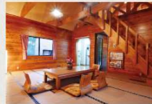
和室タイプ 7名様定員