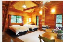
ウッドタイプ 6名様定員