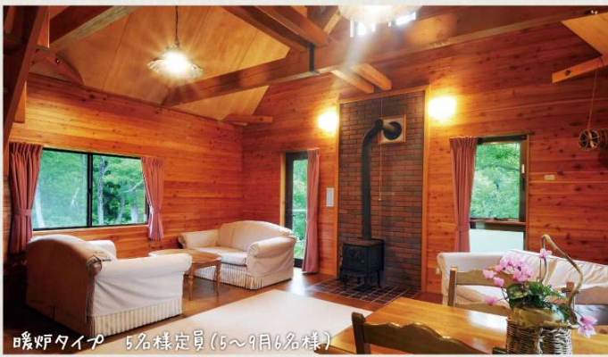
暖炉タイプ 5名様定員(5~9月6名様)

1棟のコテージに宿泊する人数により、お一人あたりの料金が変わります。人数は大人・子どもの区別なく小学生以上は1名とします。未就学のお子様で寝具をご利用頂かない場合は無料です。(大人1名につき1名様まで) 食事は、コテージ内のキッチンで自炊いただけます。 *連続で7泊宿泊されると、そのうち1泊分無料(長期滞在割引)